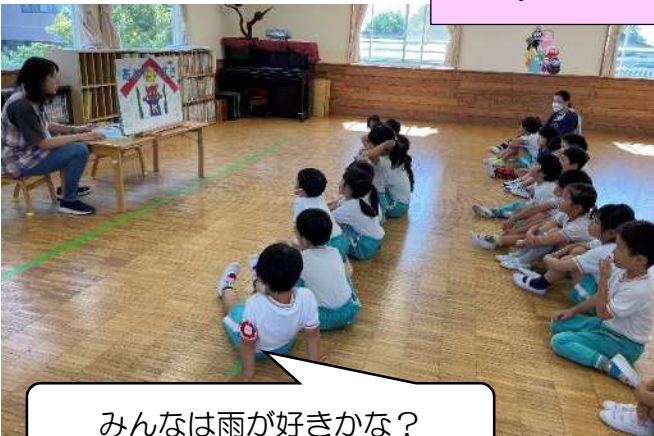
みんなは雨が好きかな？