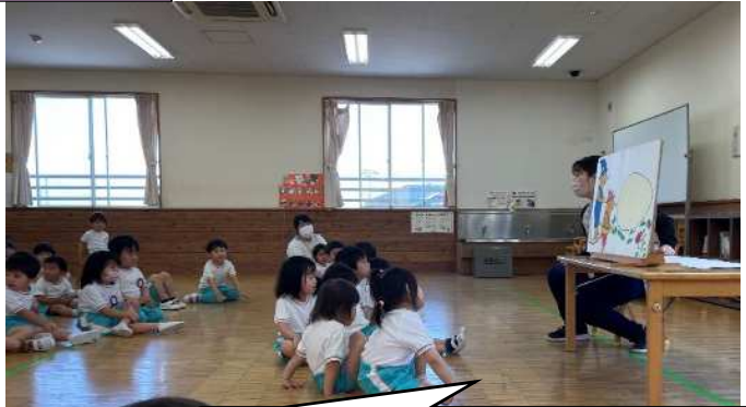
ぼくらのなまえはぐりとぐら〜♪