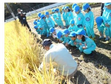
↑稲はこうやって刈るんだ～