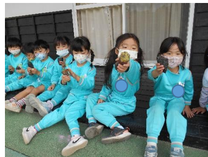
↑みんな笑顔でたいらげっていました。あ～美味しい!