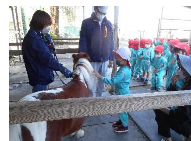
↑ポニーの毛はふさふさだよ

8日には、高崎乗馬クラブにポニー見学に行きました。ポニーはかわいかったです。大きいサラブレッドの馬もいました。